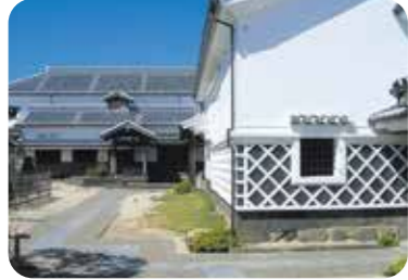
帆足本家酒造蔵(大分市指定有形文化財)