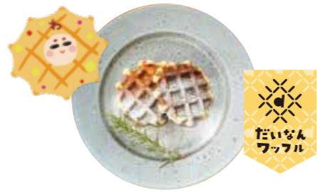
だいなんワッフル