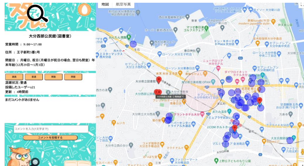
ログインした後の画面