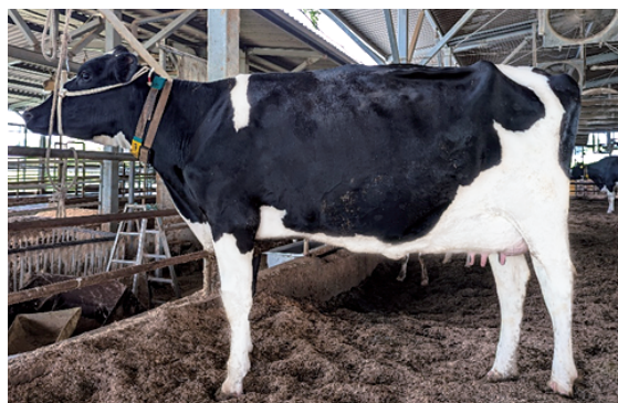
シュトウファーム アルタホットロッド ブラウン号

グランドチャンピオン受賞者には、農業委員会会長より表彰状と記念品が授与されました。