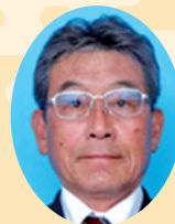
大分市農業委員会