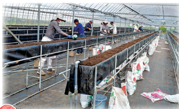
新設ハウスでの土入れ作業