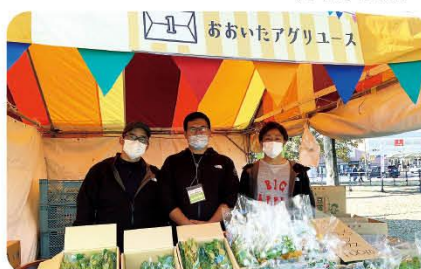
会員によるおおいたマルシェ出店 (令和3年11月)