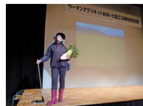
ファッションショー

式典の前には、農作業服のファッションショーなども催され和やかな雰囲気での開催となり、その後の情勢報告やパネルディスカッションなどでは農業分野での女性の参画について意見が交わされました。