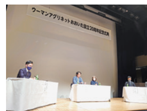
パネルディスカッション