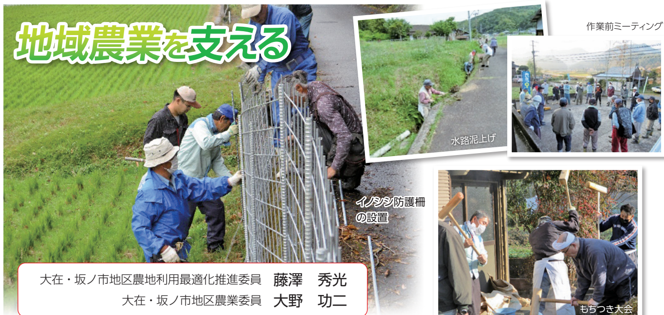
作業前ミーティング