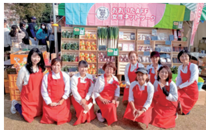
おおいたマルシェに出店