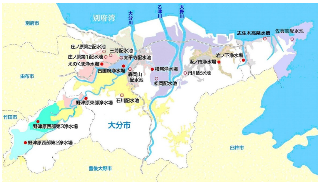
図2-1 大分市の主要浄水場並びに主要配水系統図