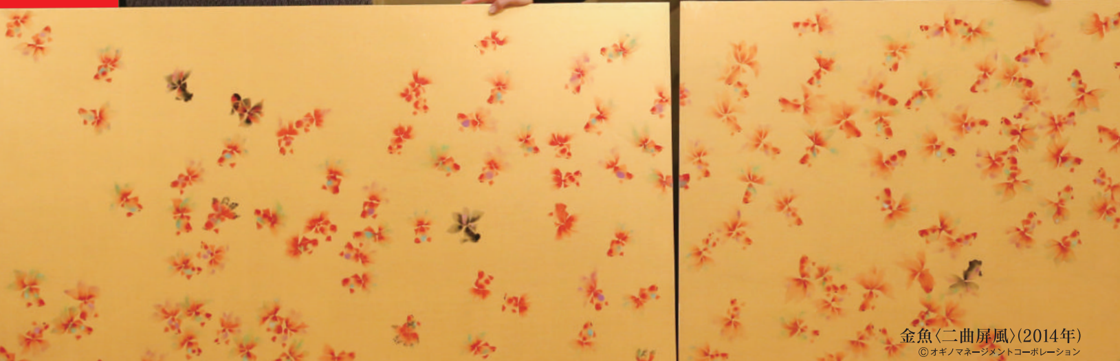
金魚<二曲屏風>(2014年) ©オギノマネージメントコーポレーション