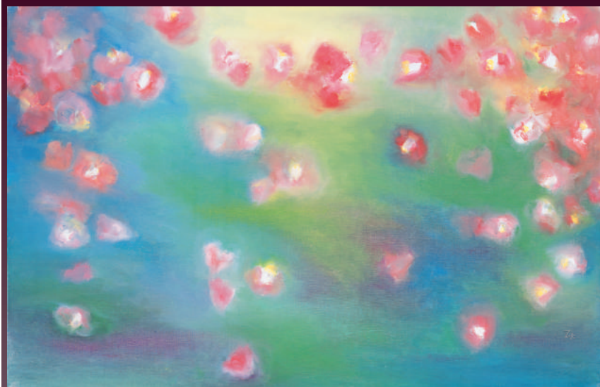
こぼれ椿 (2014年) 出世魚 (1996年)