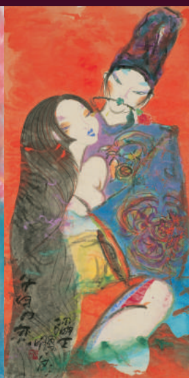
千年の恋 源氏物語 (2002年)