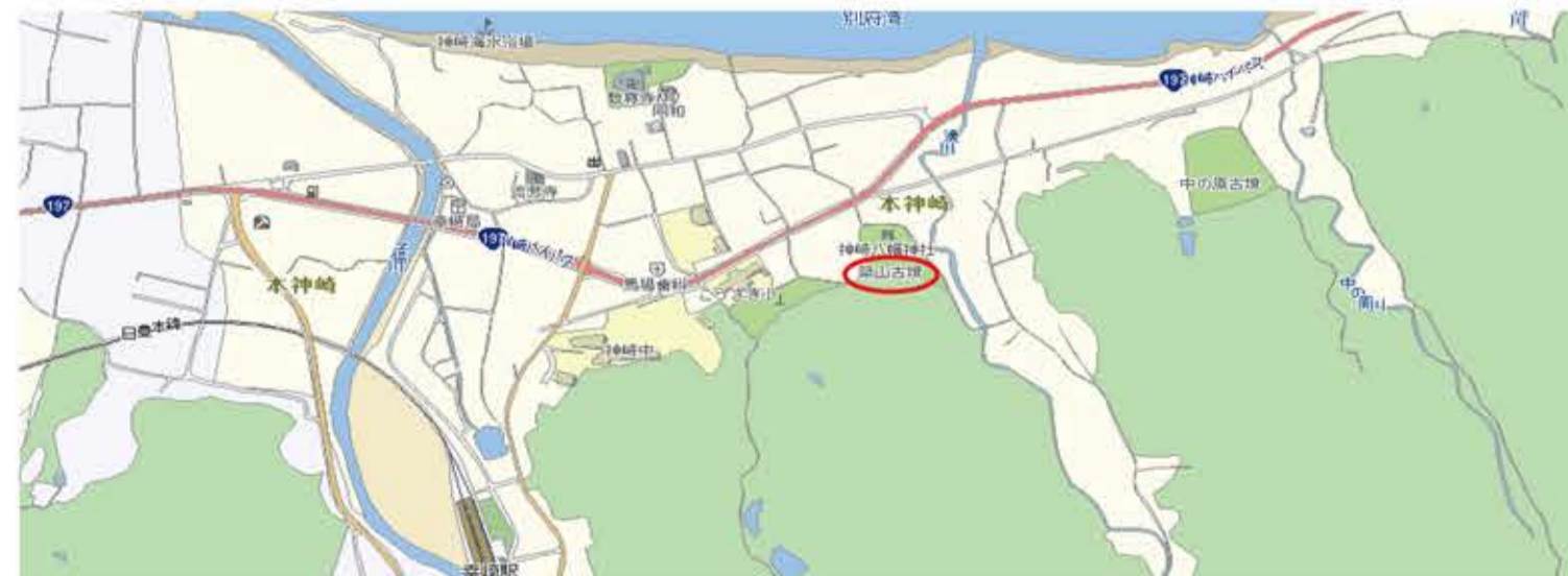
築山古墳周辺地図