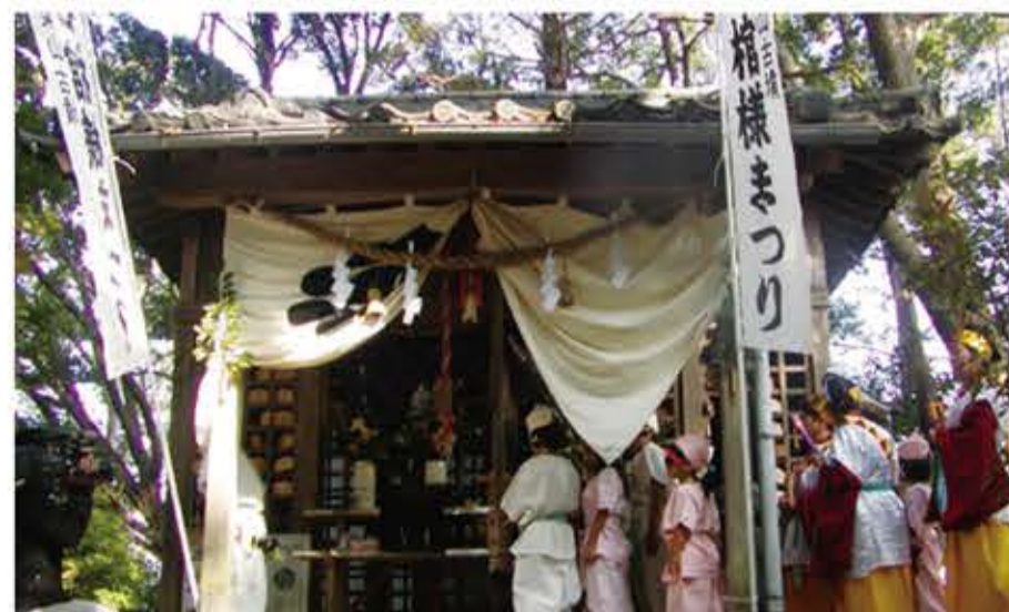
石棺様まつりのようす

石棺が発見されて以降、古墳は地元の人々から「石棺様」と呼ばれて崇敬を集め、秋になると「石棺様まつり」が盛大に催されています。