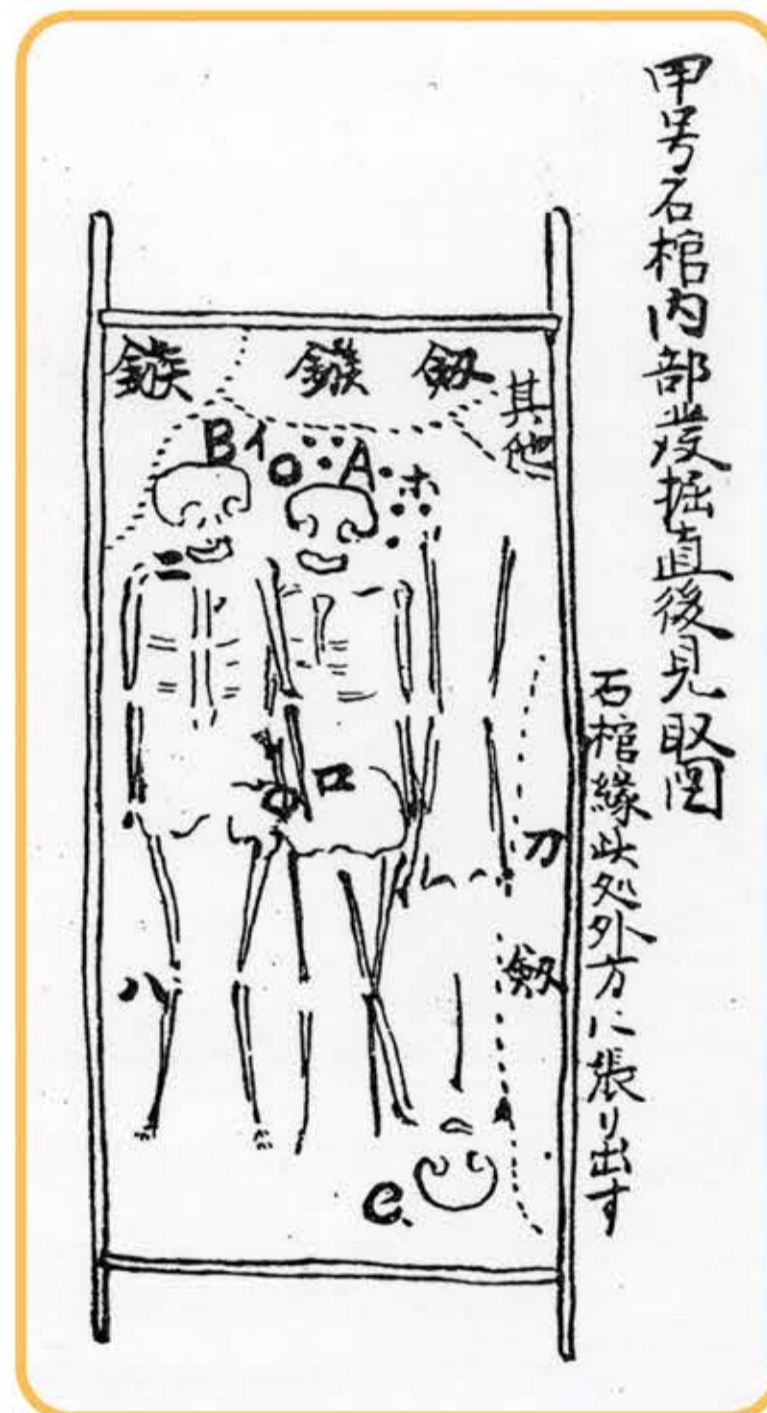
1号石棺内部発掘直後見取り図(昭和8年)