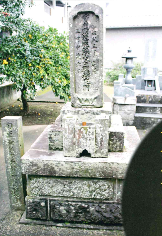
刀匠紀新太夫行平之墓地 大分市大字関園