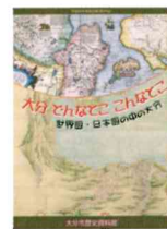
第14位 大分どんどここんどこ