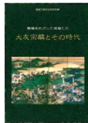
第3位 大友宗麟とその時代