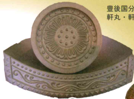
豊後国分寺跡出土 軒丸・軒平瓦（レプリカ）