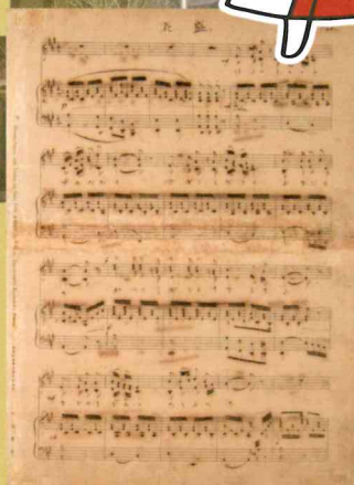
瀧廉太郎自筆楽譜 花盛り（複製品）