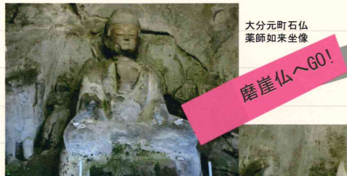
大分元町石仏薬師如来坐像