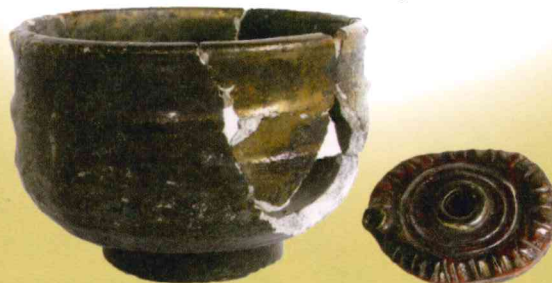
鶴崎町遺跡群（堀川）出土遺物