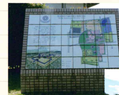
豊後国分寺跡史跡公園案内図