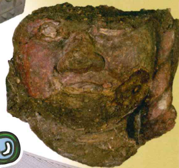
大分元町石仏 不動明王頭部