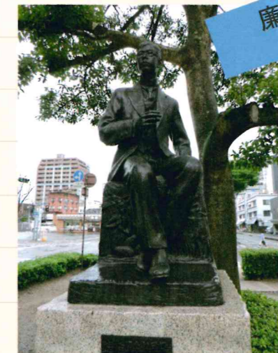
大分市大手町の瀧廉太郎像