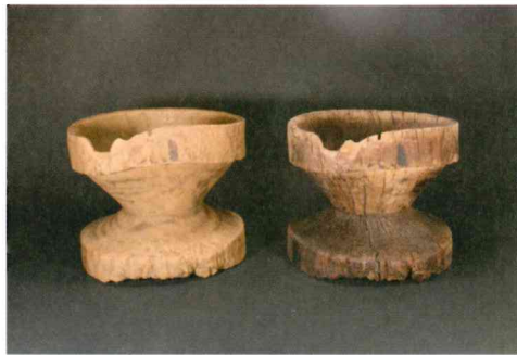
大道遺跡群出土の木製臼 右実物 左レプリカ

大道遺跡群から出土した木製臼の保存処理は、この真空凍結乾燥法を採用しました。平成22年から奈良文化財研究所で始まったこの保存処理は、昨年完了し、大分市に帰ってきました。