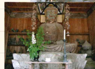
正覚寺 鉄鑄蘆舎那仏坐像