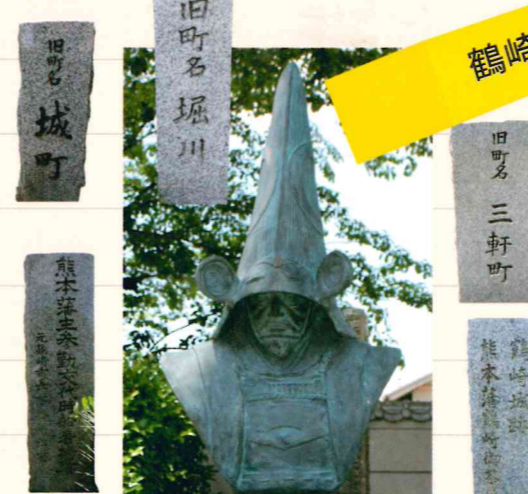
法心寺 加藤清正像と江戸時代鶴崎町を示す標柱