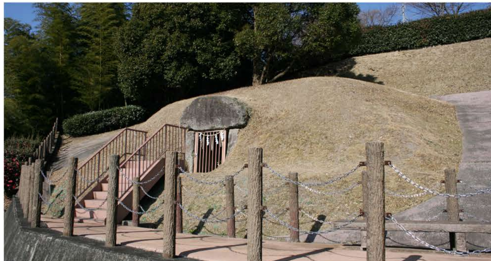
整備された古宮古墳

ふるみやこふん しいざこきゅうりょう 古宮古墳は、椎迫丘陵の南側斜面にある南北約12.5m、東西約12mの方墳です。7世紀後半の築造と考えられ、九州で唯一の横口式石槨をもつ古墳として、昭和58年(1983)に国の史跡に指定されました。