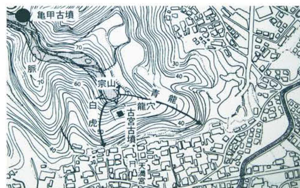
風水思想からみた古宮古墳