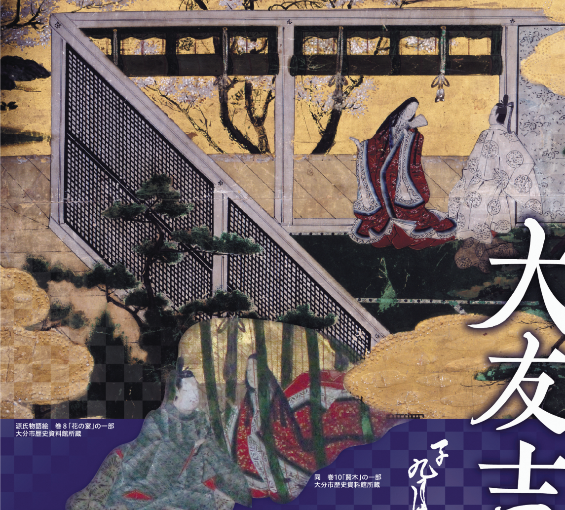
源氏物語繪 卷8「花の宴」の一部 大分市歴史資料館所蔵