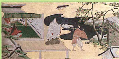
源氏物語図「末摘花」(巻6)