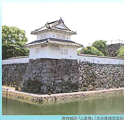
府内城跡「人質櫓」[大分県指定史跡]