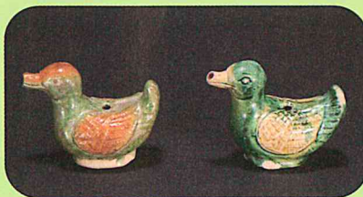
華南三彩鳥形水筒