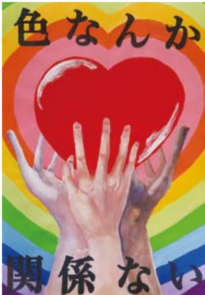
色なんか関係ない