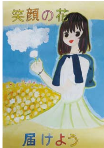
笑顔の花を届けよう ひら まつ はる な (日岡小学校)