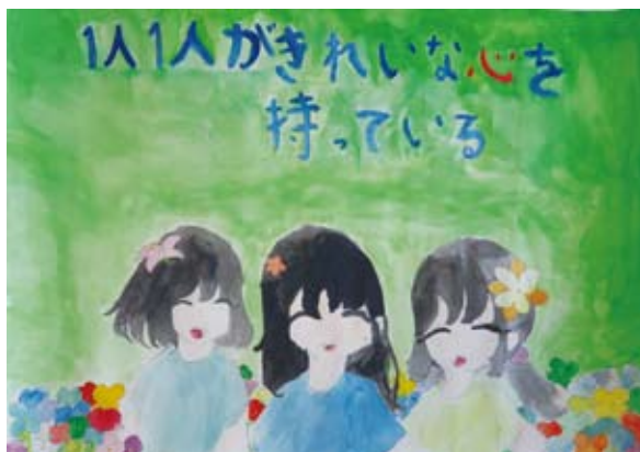
きれいな心 ふく だ あや め (日岡小学校)