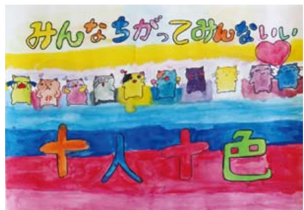
十人十色 なが 長 友 遥 愛 (日岡小学校)