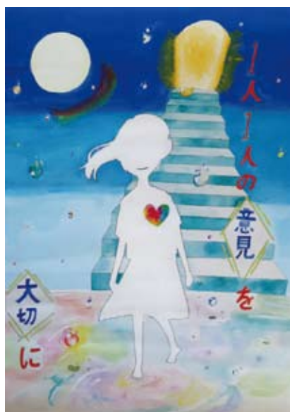
皆の意見を大切に あ なん ゆい か (大在中学校)