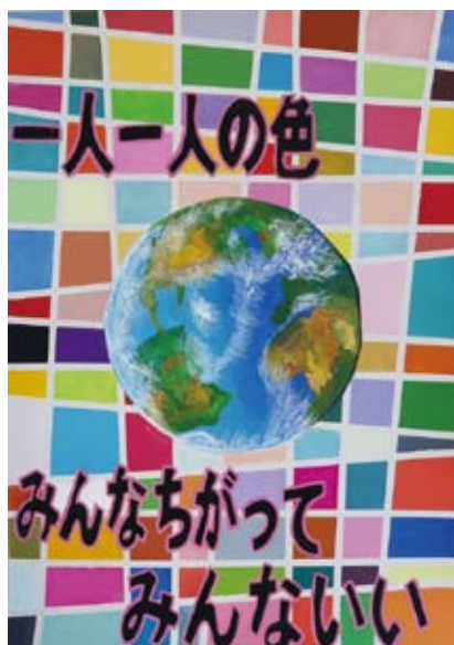
everyone is different なが い みず き (城南中学校)