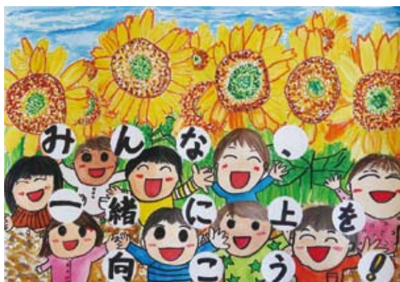
みんな一緒に 上を向こう! こん どう ゆう ま (西の台小学校)