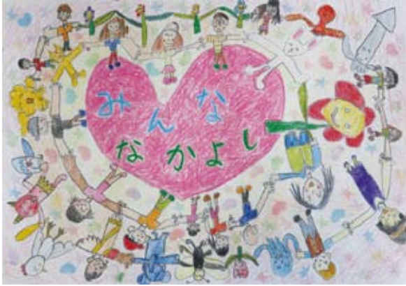
みんな なかよくしてね 伊 東 杏 桂 (判田小学校)