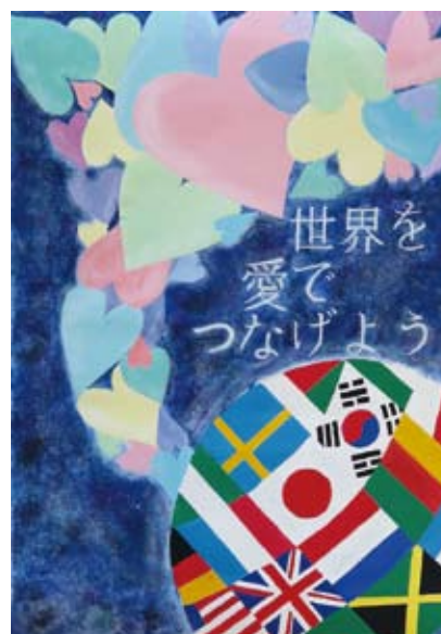
世界を平和に やす だ ち なん (野津原中学校)