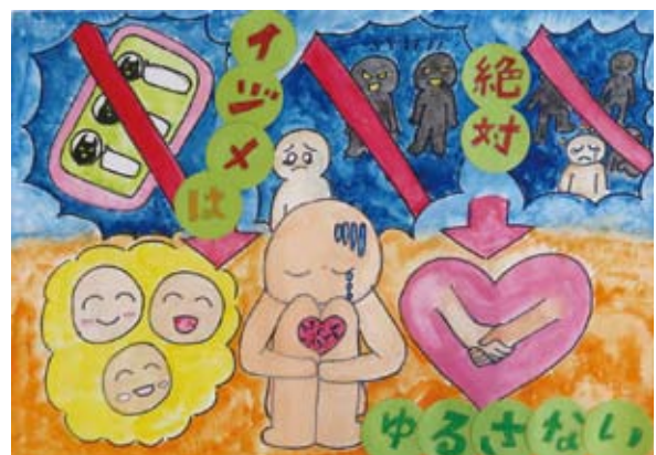
いじめは絶対ゆるさない あお き にい な (明野北小学校)