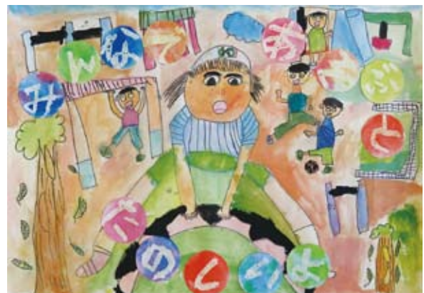
みんなであそぶとたのしいよ 庄 司 颯 人 (明野北小学校)