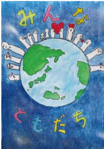
みんな ともだち かわ はら がつ 岳 (日岡小学校)