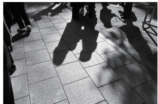
「見えない言葉」 大分市人権フォトコンテストの作品