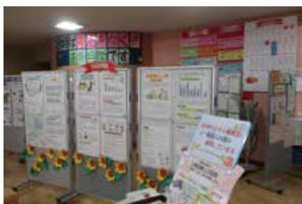
差別をなくす運動月間(8月)の取組