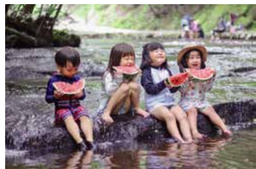
「夏の思い出」 大分市人権フォトコンテストの作品

自分に様々な面があるように、相手にも様々な面があるものです。一面だけを見て相手を判断するのではなく、いろいろな視点から見て考えることが、相手への理解を深めることにつながります。