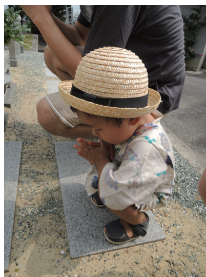
大分市人権フォトコンテストの作品

このように、 子どもを愛し認めること、特に幼少の頃から子どもに対して身近な大人がどのように接していくかが重要 であると言われていいます。