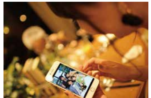
「幸せになろうね」 大分市人権フォトコンテストの作品

例えば、ある子どもに対して「生活態度が良い」というイメージが一旦形成されると、そのイメージに合致する情報のみが印象に残り、良いイメージが一層強調されるようになります。もし、その子どもがイメージと合致しない行動をとったとしても、「この子には、こんな部分もあるのか」などと例外扱いし、イメージの悪化にはつながらないという傾向が指摘されています。