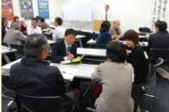
にんげんセミナー

地域や企業等において人権啓発に取り組むリーダーを対象とした「にんげんセミナー」、中学生・高校生を対象とした「にんげん劇」(演劇等)を開催しています。