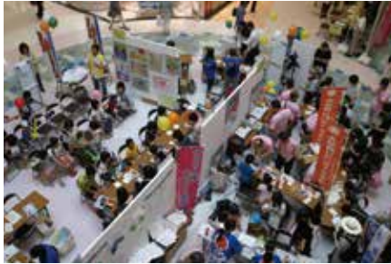
おおいた人権フェスティバル

また、大分市内にある13の地区公民館と36の校区公民館、573の自治公民館が中心となり、暮らしの中の人権講座、映画・ビデオ上映会、パネル展示、人権・同和問題専門講座、人権標語など地域の実情に応じて、人権・同和教育の推進が図られています。（※公民館数2022(令和4)年1月現在）