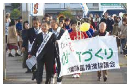
人権啓発パレード