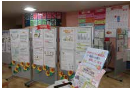
差別をなくす運動月間(8月)の取組