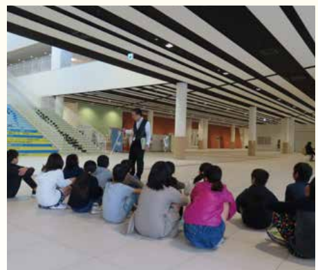
バリアフリー施設見学