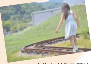
人権を考える講演会 (PTA対象)