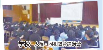
学校 人権・同和教育講演会