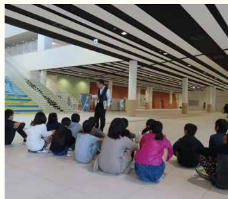
バリアフリー施設見学