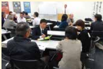
にんげんセミナー

地域や企業等において人権啓発に取り組むリーダーを対象とした「にんげんセミナー」、中学生・高校生を対象とした「にんげん劇」(演劇等)を開催しています。