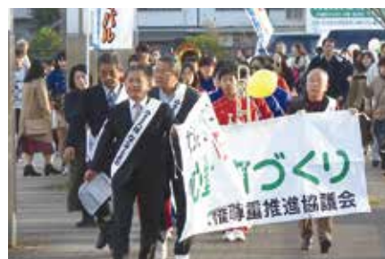
人権啓発パレード