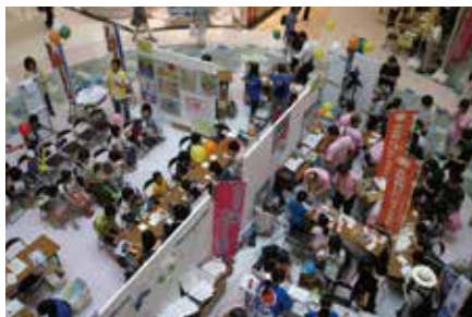
おおいた人権フェスティバル

また、大分市内にある13の地区公民館と35の校区公民館、570の自治公民館が中心となり、暮らしの中の人権講座、映画・ビデオ上映会、パネル展示、人権・同和問題専門講座、人権標語など地域の実情に応じて、人権・同和教育の推進が図られています。（※公民館数2019年12月現在）