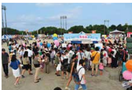
夏祭りでの啓発活動