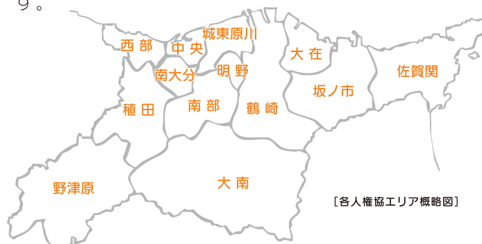
【各人権協エリア概略図】

よる地区懇談会などを実施したり、人権標語の募集・掲示などの啓発活動に取り組んだりしています。