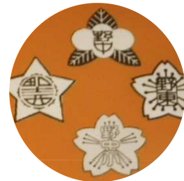
現在の校章 (野津原西部小学校HPから)