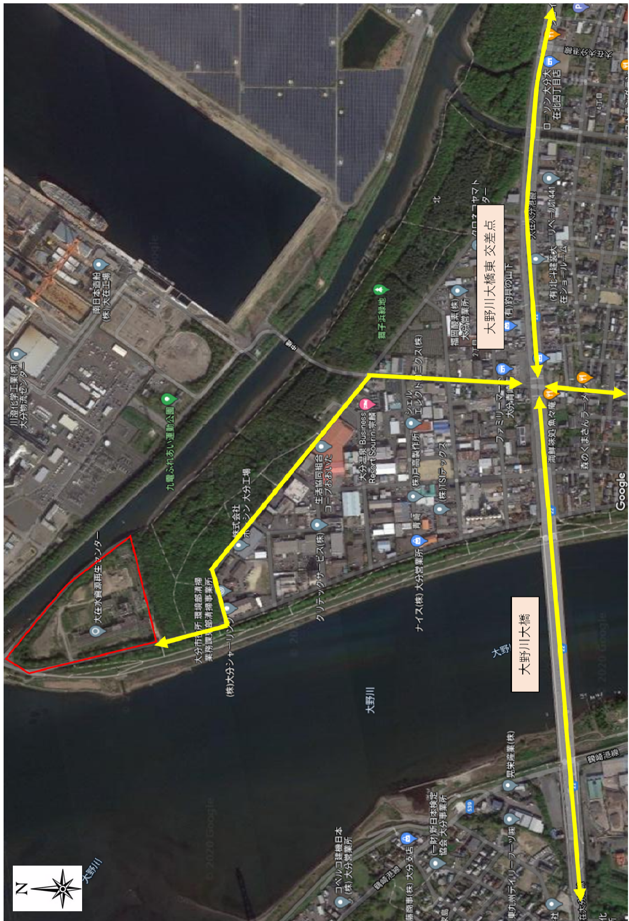
図-2 下水汚泥及び固形燃料運搬車両走行ルート