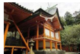
早吸日女神社本殿

佐賀関地区は、古代から続く港町である。早吸日女神社の祭礼は、佐賀関に住む人々が広く参加して行われる祭りで、神輿や山車の巡行は、まちの広範囲におよぶ。祭礼は、海との繋がりを基本としながらも当地区がもつ伝統をすべて含んでいる。このように、早吸日女神社と祭礼により良好な歴史的風致を形成している。