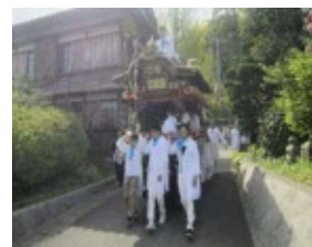
八幡神社 春季祭礼の様子

本神崎地区では、神輿や山車を用いた伝統的な春季祭礼がまち全体を舞台として行われている。また、昭和初期に発見された「石棺」を祀るために始められた祭礼も既に伝統行事となり定着している。その舞台となる八幡神社と築山古墳を起点とする2つの祭礼が当地区の人々によって受け継がれながら歴史的風致を形成している。