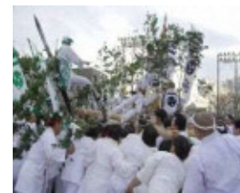
剣八幡神社 春季祭礼の様子

鶴崎地区は、江戸時代に熊本藩領であり、参勤交代の際には藩主休憩所としてまた、肥後熊本藩の豊後領における拠点を統治する拠点として「御茶屋」が設けられ、その周辺に港や町が整備された。熊本藩とのつながりに起源をもつ建造物とそれに関わる祭礼が今も受け継がれており、まちなみと一体となった歴史的風致を形成している。