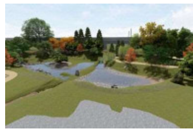
大友氏館跡庭園整備イメージ CG