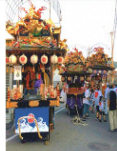
山車巡行中の様子

萩原地区は岡藩の港町として整備され、府内藩の所領となってから製塩業によって町が栄えた。江戸時代には人形を町に飾る行事があり、人形山車として引き継がれている。このような歴史的な背景とまちなみを人形山車が巡行する祭りが幅広い世代により維持され、まちなみと祭礼行事が密接に結びついた歴史的風致を形成している。