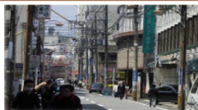
歩行空間を阻害する電柱