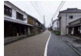
戸次本町のまちなみ

戸次地区は、大分市内で最も良好な歴史的なまちなみが残っており、江戸時代には臼杵藩の在町としての歴史と伝統を受け継いでいる。このまちなみを守り、次世代へつなげていこうとする地元住民の熱意のもとで、伝統的な祭礼が守り伝えられており、まちなみと一体となった歴史的風致が形成されている。