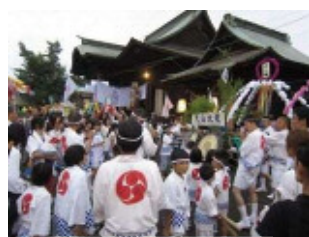
祭礼 浜の市の様子

杵原八幡宮の祭礼は、八幡地区の人々が参加して受け継がれており、それが行われる道や建物が一体となって、歴史的風致を形成している。