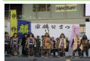
宗麟公まつりの様子