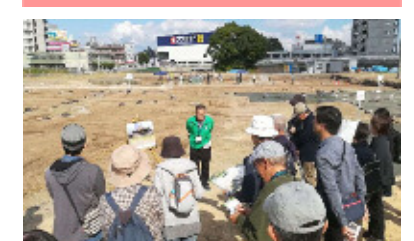
大友氏遺跡について説明する市民ガイド