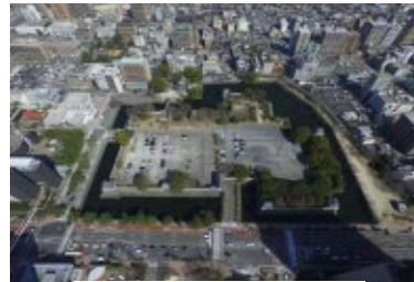
大分城址公園の現在の様子