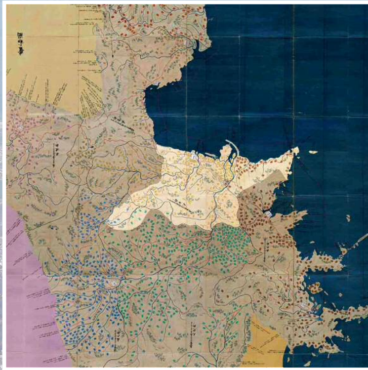
「天保国絵図 豊後国」より