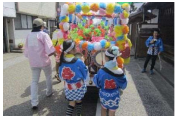
神輿につづく子供太鼓山車