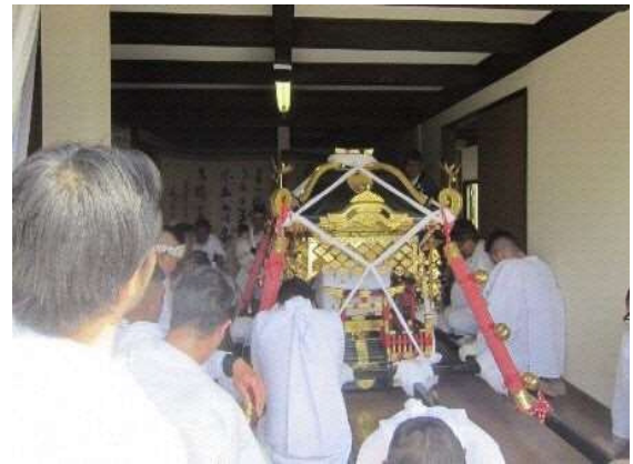
旧富士見楼に神輿が入る

「帆足家分家住宅」に神輿が到着し、金子家住宅と同じように玄関すぐの部屋に神輿が入る。部屋は他の部屋より一段低く造られており、神輿が入れやすくまた神棚が設けられている。神輿と山車が中戸次地区を巡行し、八幡神社へ還幸する。