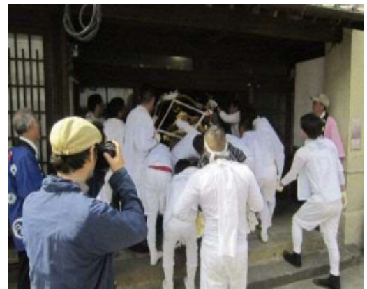
金子家住宅への立ち寄り