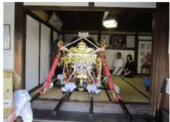
帆足家分家住宅に入った神輿