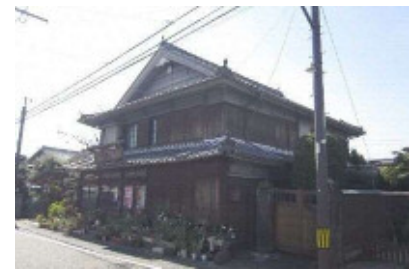
旧二十三銀行出張所

旧二十三銀行出張所は、木造入母屋造棧瓦葺二階建てで、『戸次本町街なみ景観形成計画報告書』(平成13年(2001))によれば明治33年(1900)に陶器店として建築された建物で、その後一時旧二十三銀行となった。