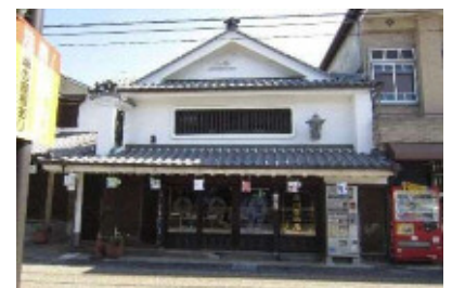
藤川金物店 (旧呉服店森屋)

藤川金物店は、明治元年(1867)の建築で木造入母屋造棧瓦葺二階建てで、『戸次本町街なみ景観形成計画報告書』(平成13年(2001))によれば天保元年(1830)に呉服店として開業した。昭和30年代に大きな改築を行っているが、洪水時に天井板を開閉して呉服店の商品を2階に上げられるようにする仕掛けが残っている。