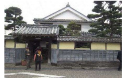
旧帆足杏雨宅 擅勝閣

旧帆足杏雨宅は、木造入母屋造棧瓦葺の二階建て住宅で、『戸次本町街なみ景観形成計画報告書』(平成13年(2001))によれば安政3年(1856)の建築であり、南画家の帆足杏雨の旧宅であった。