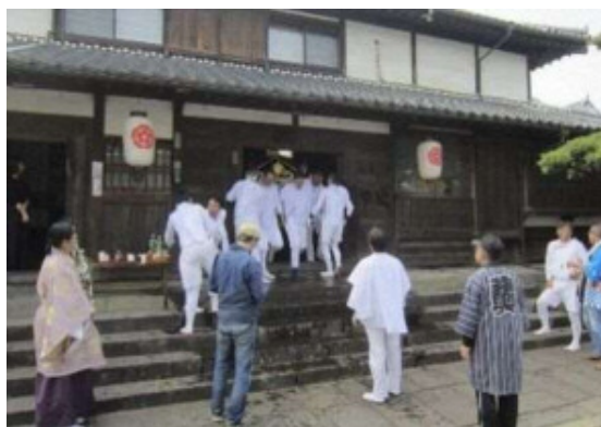
帆足家分家への到着

「帆足家分家住宅」に神輿が到着し、金子家住宅と同じように玄関すぐの部屋に神輿が入る。部屋は他の部屋より一段低く造られており、神輿が入れやすくまた神棚が設けられている。神輿と山車が中戸次地区を巡行し、八幡神社へ還幸する。