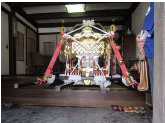
金子家住宅に安置された神輿