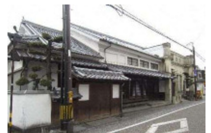
金子家住宅(旧呉服店万太・旧戸次郵便局)

金子家住宅は、鶴崎にあった熊本藩主細川家別宅を戸次に移したと伝えられる。『大分県の近代和風建築』(平成25年(2013))によれば、建築年は、大正2年(1913)で式台付玄関がある武家屋敷風の建物である。八幡神社春季祭礼時に神輿が入る部屋は他の部屋より一段低い。