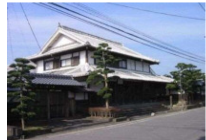
帆足家分家住宅 松石不老館

帆足家分家住宅は、主屋は『戸次本町街なみ景観形成計画報告書』(平成13年(2001))によれば明治39年(1906)に建築され、「松石不老館」と称された。敷地東側の通りに面し、通り土間をもつ商家建築の形式で、北側に座敷や次の間を配して接客空間とする。接客部分の各部屋の意匠は優れ、近代の大工技術の高さがうかがえる。この他、新座敷、質蔵、塀など明治中期に建てられた建造物10件も登録文化財となっている。