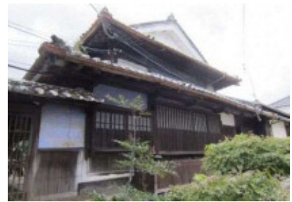
帆足家本家住宅 富春館

帆足本家住宅は、臼杵藩の在町であった大分市南部の戸次 へつぎ にあり、近世には大庄屋を務めた。主屋は『戸次本町街なみ景観形成計画報告書』(平成13年(2001))によれば慶応元年(1865)に建築され、「富春館」と称された。木造二階建一部平屋、入母屋造、 いりもや 棧瓦葺で、南側中央に式台 しきだい 玄関を設け、西側に一段高い座敷、北側に仏間、東側に居室を配する。床の間の造りなど本家主屋として意匠、材料、技術共に秀でる。この他、宝蔵、中門、塀など江戸末期から昭和初期の建造物7件が登録文化財となっている。