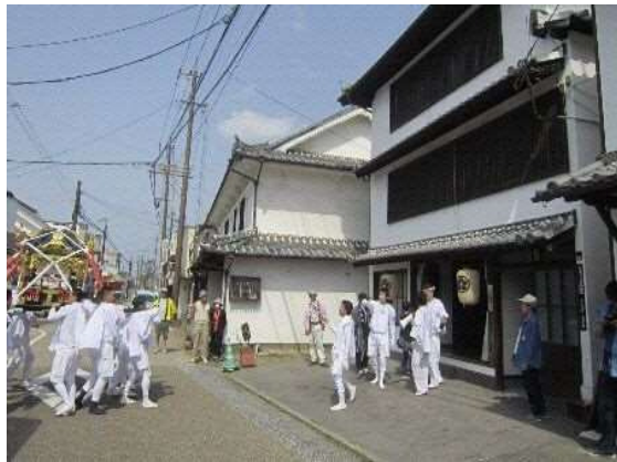
旧富士見楼での神輿の妨害

「旧富士見楼」では、唯一玄関に入ろうとする神輿を押し留め、入らせないように妨害をする。妨害するのは主に7名ほどの男性で、数回神輿を妨害した後、玄関への進入を許す。その後は他と同じように祝詞があげられ、御幣が渡される。