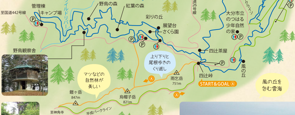
大分県民の森にある平成森林公園。広い敷地に様々なエリアがあり、四季折々の自然を楽しめる。