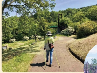
ラベンダーの丘を囲むように散策できる。