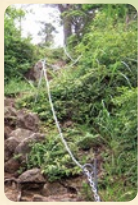
急な斜面には鎖が整備されている。