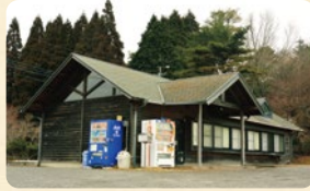
エリアの中心にある四辻茶屋。