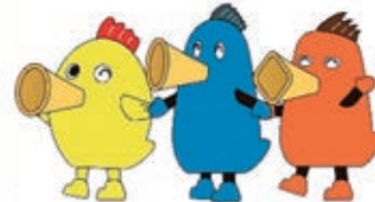
キッピー スータン ナビー