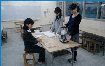
■市民リサイクル体験工房 紙すきや石鹸作りなどのリサイクルを体験できます。