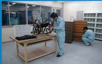
■家具再生工房 粗大ごみとして回収された家具の中から、まだ使えそうなものを修理・再生します。