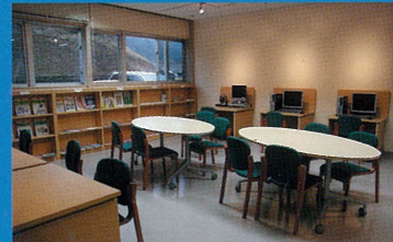
■エコライブラリー 環境問題について本やビデオを見たり、パソコンを使って調べたりすることができます。