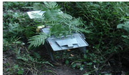
枝葉で覆った箱わな