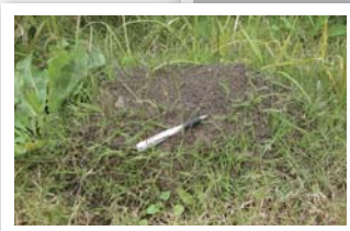
ヒアリが作る大きなアリ塚