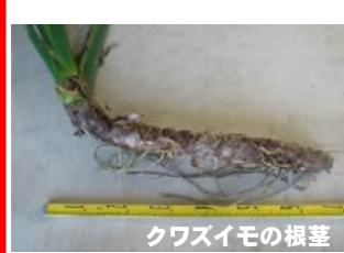
クワズイモの根茎