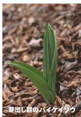
芽出し期のバイケイソウ