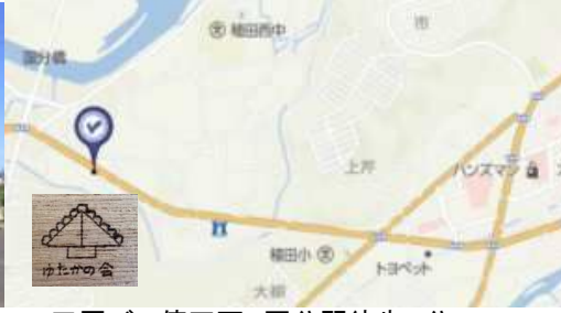
田原バス停正面。国分駅徒歩5分