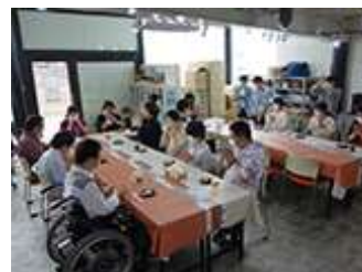
様々なレクリエーションを企画