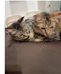
猫のお世話作業も♪