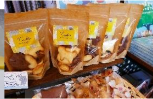
クッキーをみんなで焼いて販売したり・・・