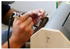
ヒューズ管の半田付け作業