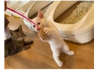
bホープはかぎのしっぽの2階です！