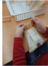
アメニティの袋入れ