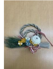
お正月飾りにも挑戦！可愛いものができました