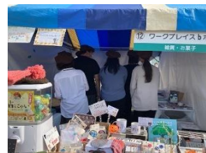
輪い笑いフェスタに出店もしました！