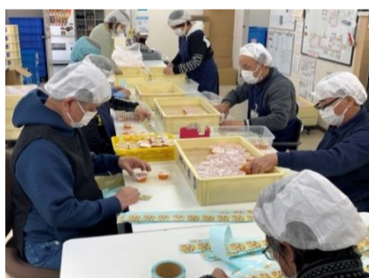
お菓子の個装/箱折り