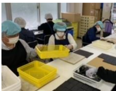
プラスチック製品の 治具取付