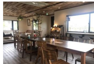
(おうちカフェ内観)