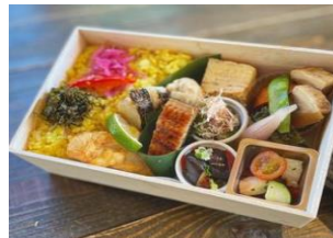
(1F カフェテイクアウト弁当)