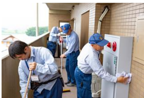
清掃風景(マンション共用廊下)