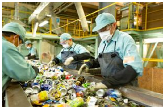
リサイクルプラザ選別業務