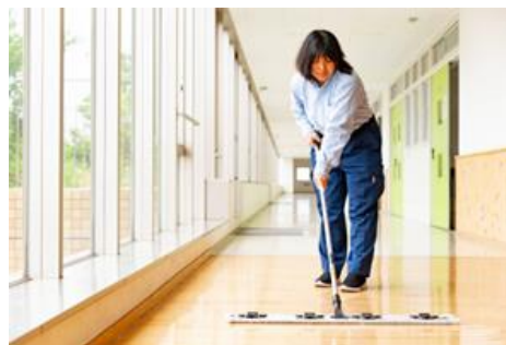
公共施設共用廊下清掃