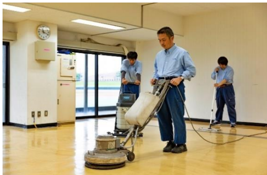
ポリッシャー洗浄