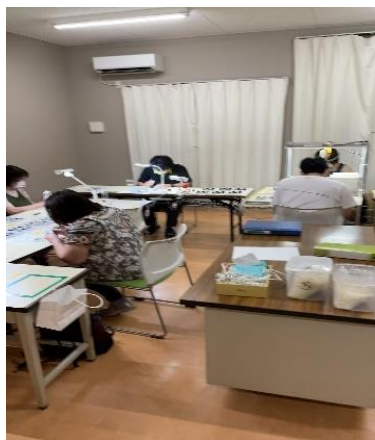
←カメラ部品の製造