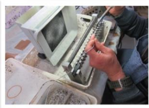
ヒューズのはんだ付け作業