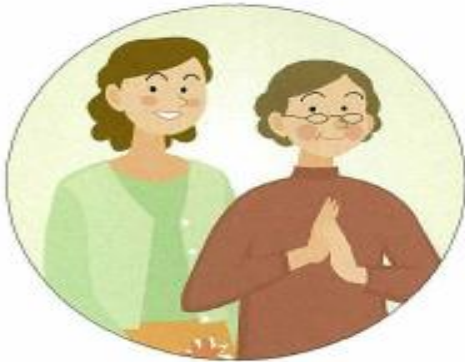
高齢者や高齢者を介護する家族 (依頼会員)