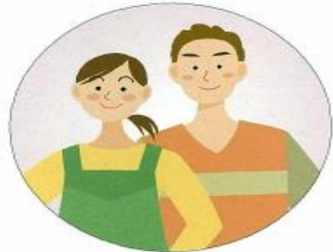
高齢者の援助を行いたい人 (援助会員)