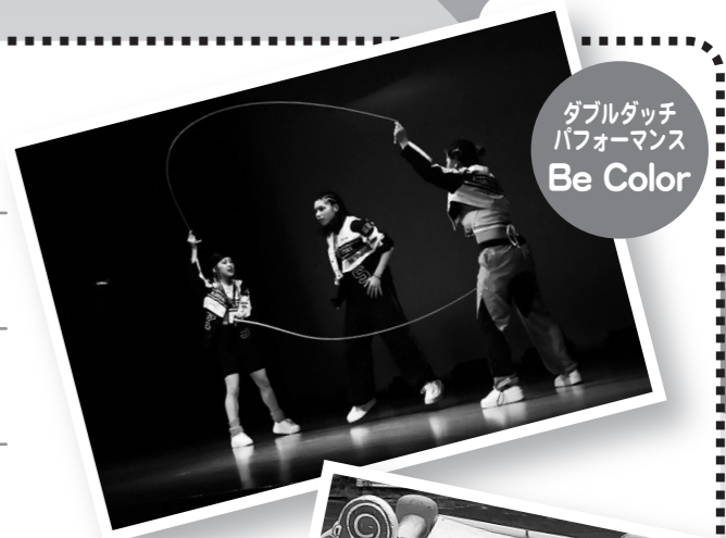
ダブルダッチパフォーマンス Be Color