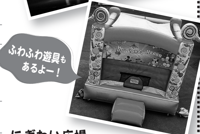
ふわふわ遊具もあるよー!