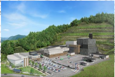
新環境センター イメージ図