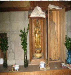
⑥ 戸次四国三十三ヶ所 1番札所・川原山観音堂