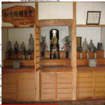
⑦ 戸次四国三十三ヶ所 2番札所・観音堂