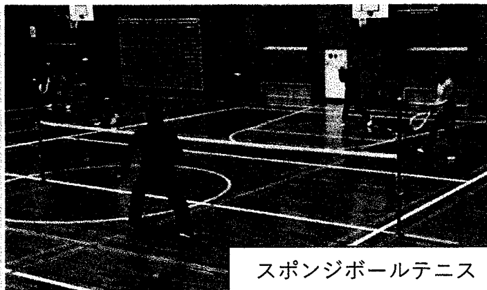
スポンジボールテニス