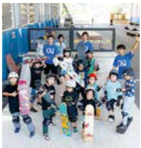
撮影にご協力いただいた皆さん

市では、10月8日(日)・9日(月)にアーバンスポーツを体験できるイベント「OITA URBAN SPORTS FES 2023」(6ページ掲載)を開催します。皆さんもこの機会にアーバンスポーツを体験してみてください。