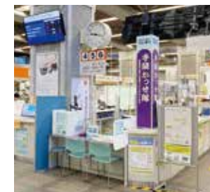
手続かせ隊（本庁舎1階）