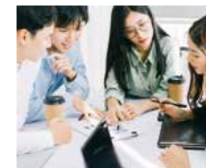
若者ワークショップ（イメージ）