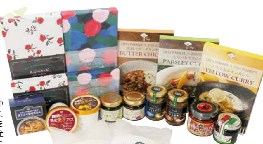
今回開発された新商品