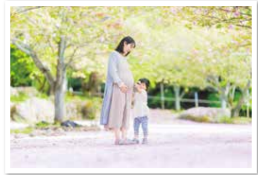
2021人権フォトコンテスト 最優秀作品 『つなぐ～母から娘へ 娘から妹へ～』

「がんばる人を応援したい」「立ち止まってしまった人の背中を押してあげたい」「たまには自分だって応援されたい」そのような場面を日ごろの感謝の気持ちとして一枚の写真にのせて、『ありがとう』と伝えてみませんか。