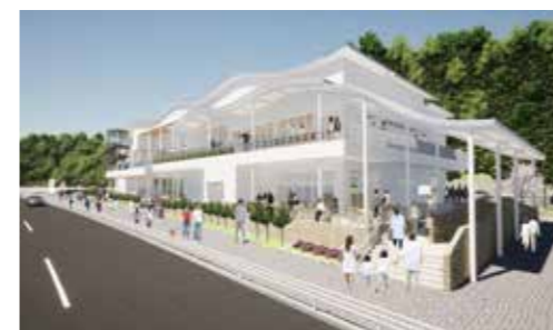
ホームページはこちら▼