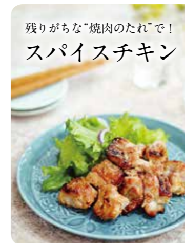
残りがちな「焼肉のたれ」で！ スパイスチキン

【材料】(4人分) 鶏もも肉……300g 油……………大さじ1 焼肉のたれ…大さじ4 塩……………少々 カレー粉……大さじ1 こしょう……少々