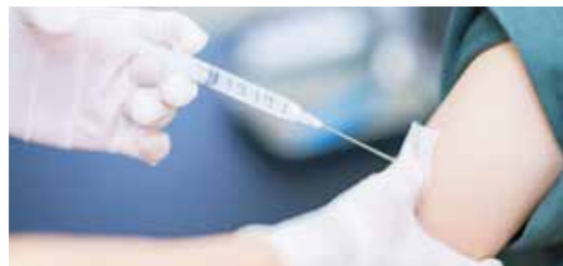
☎ 保健所保健予防課 ☎535-7710